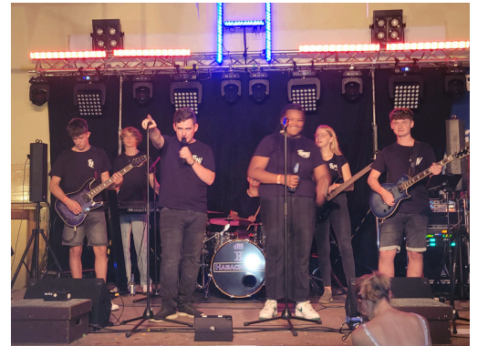
Livemusik im JUZ